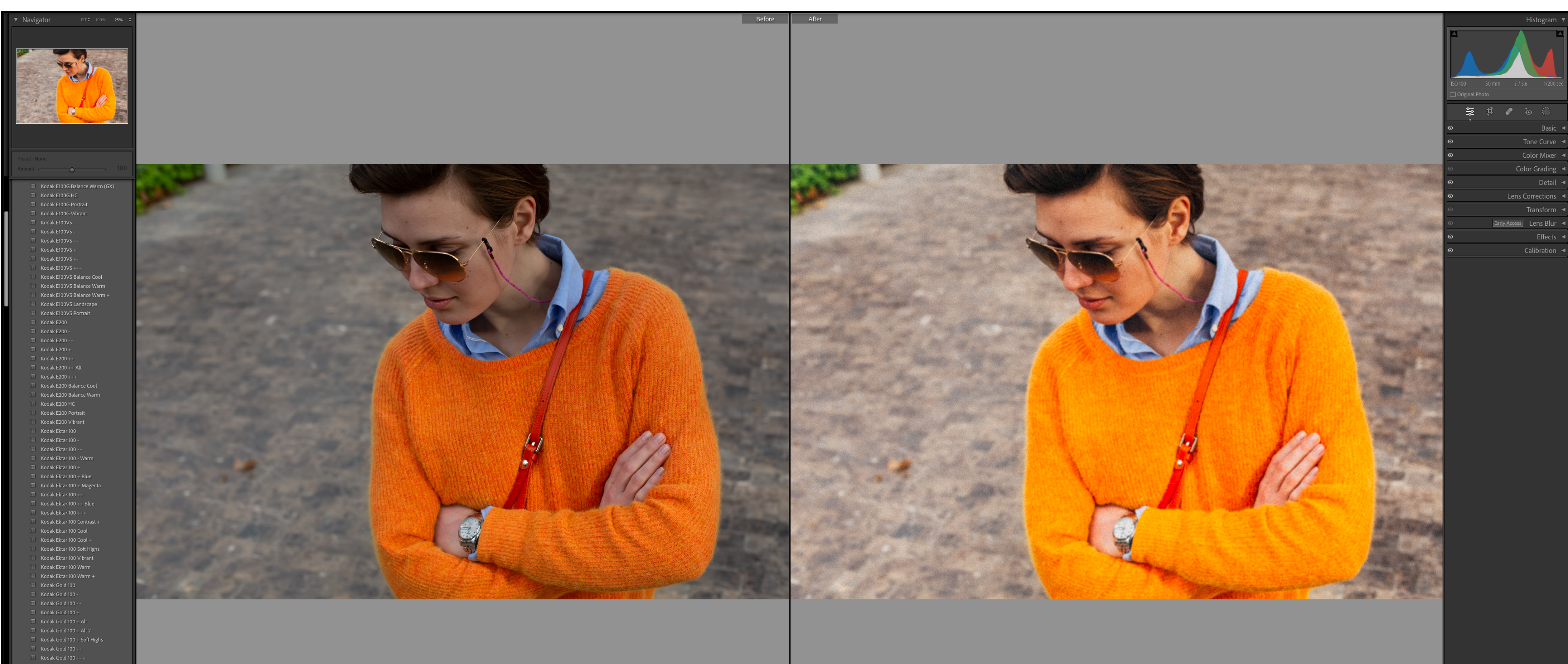
Kodak Ektar -- og Grain Bigger +